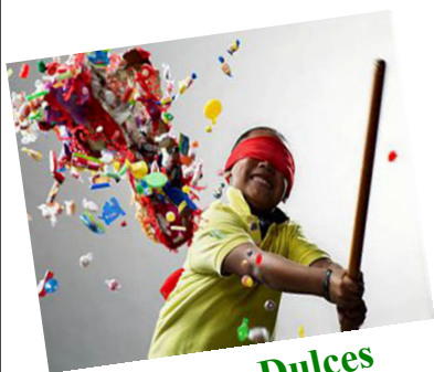
Pinata y Dulces

FIESTA EN EL BARRIO! AÑADAN AL CALENDARIO! Sábado 17 de Septiembre